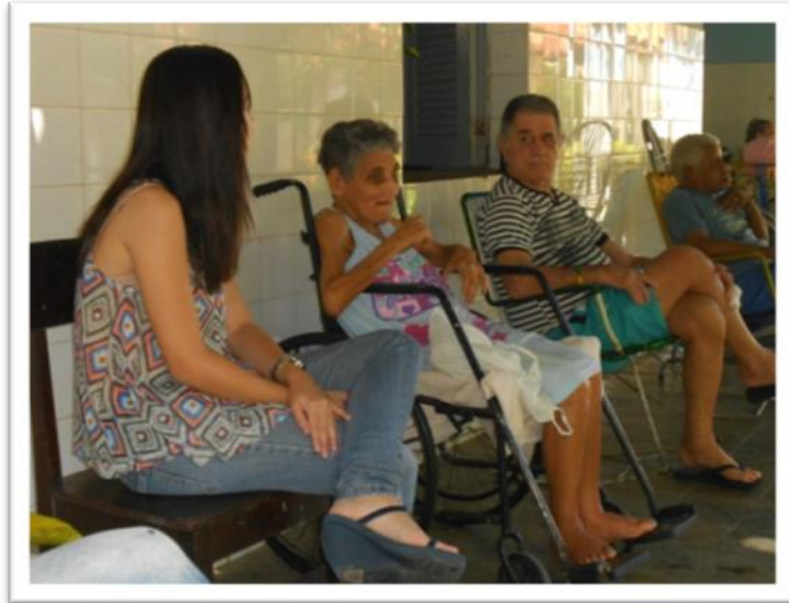
Momento de atividade física com os